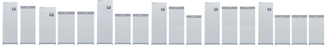
SCHÉMA DU SYSTÈME