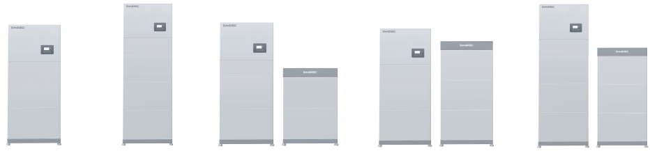
SCHÉMA DU SYSTÈME